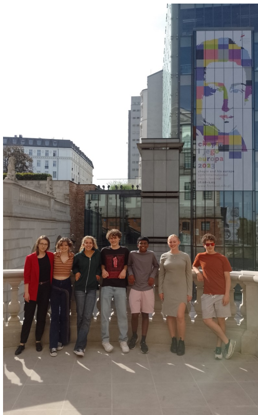
Uczestnicy FLEX Abroad podczas zwiedzania Muzeum Fryderyka Chopina w Warszawie.

Osoba uczestnicząca może identyfikować się z konkretną religią lub nie identyfikować się z żadnym wyznaniem. W programie FLEX Abroad biorą udział osoby pochodzące z rodzin o różnym statusie społeczno-ekonomicznym. Najważniejszą cechą, która jest wspólna dla wszystkich uczestników i uczestniczek jest ich zainteresowanie wymianą międzynarodową , a także kulturą i językiem polskim .