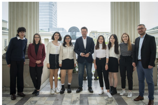
Uczestnicy FLEX Abroad podczas wizyty u Prezydenta Warszawy, Rafała Trzaskowskiego.

Formularz Zgłoszeniowy dla rodzin goszczących: FORMULARZ