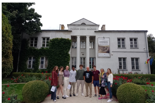
Uczestnicy FLEX Abroad w Muzeum Ziemi Mińskiej w Mińsku Mazowieckim.