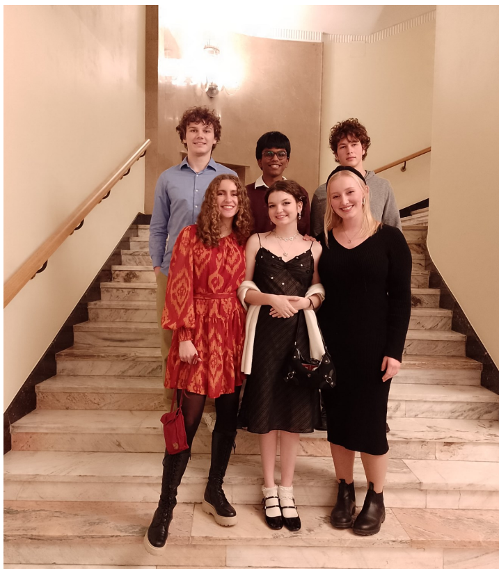
Uczestnicy FLEX Abroad podczas wizyty w Filharmonii Narodowej w Warszawie.