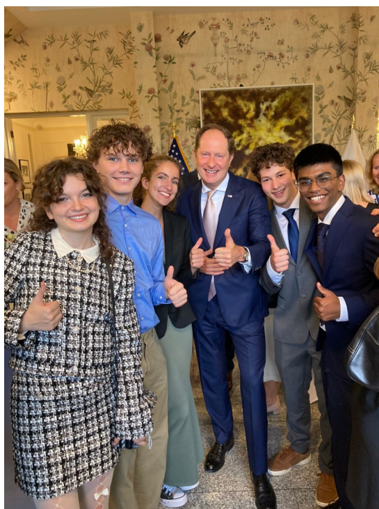
Uczestnicy FLEX Abroad z Markiem Brzezińskim, Ambasadorem USA w Polsce.