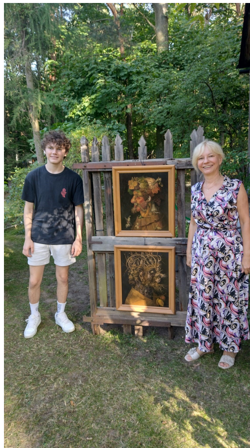
Chase ze swoją host mamą.